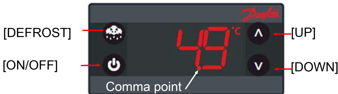
Fig. 1: Operating elements and display indicators (symbols)

Buttons are provided as operating elements which are used as follows: