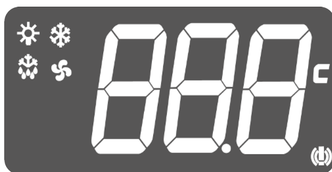
Fig. 2: Display